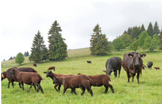
Pascolo misto con pecore e bovini da carne.