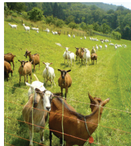
Rete elettrificata utilizzata per contenere un gregge di capre da latte.