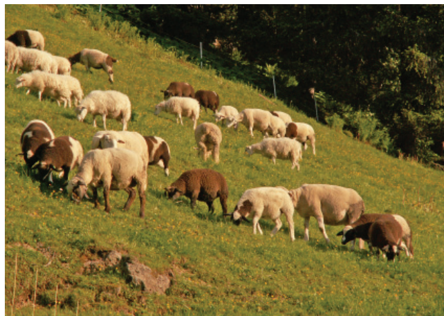
Le pecore pascolano in modo selettivo e fin quasi a livello del terreno, strappando le piante alla base del fusto.