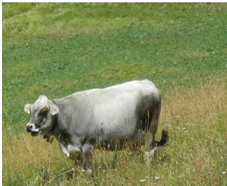
La Grigia alpina è una razza rustica, adatta alla gestione delle aree montane marginali.