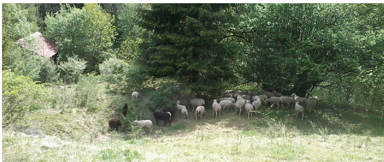
Un riparo naturale come quello rappresentato in questa fotografia soddisfa i requisiti minimi posti dalla legge sulla protezione degli animali.