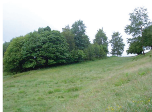
Il tasso di rimboschimento di un pascolo non dice tutto: bisogna anche considerare le caratteristiche delle piante legnose interessate (velocità di crescita, modalità riproduttive, ecc.) e la pressione esercitata dagli animali al pascolo.

Osservare l'insieme di questi parametri permette di valutare il rischio di rimboschimento e l'effettiva possibilità di gestire l'area pascolando. La valutazione va fatta seguendo regolarmente alcune piccole superfici campione, dove si possa apprezzare la crescita delle piante legnose e l'impatto che il pascolo ha su di esse.