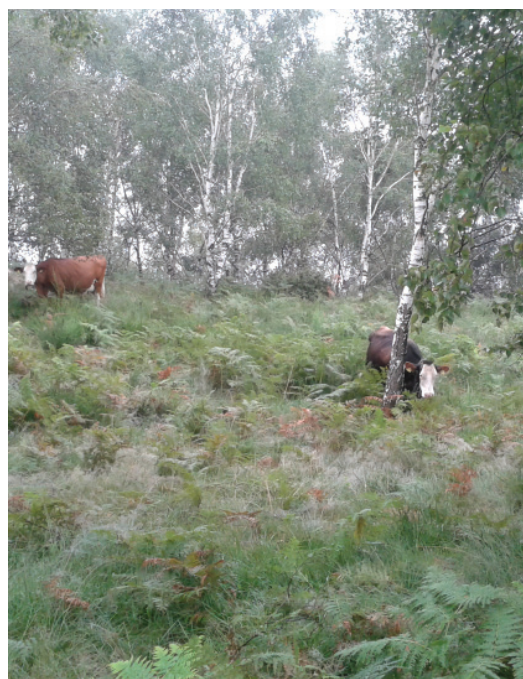
Ben gestiti, gli erbivori domestici sono di grande aiuto per contrastare il rimboschimento dei pascoli.