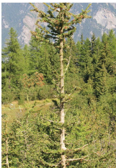
Giovane larice decorticato (sinistra) e abete rosso brucato (destra) dalle capre.