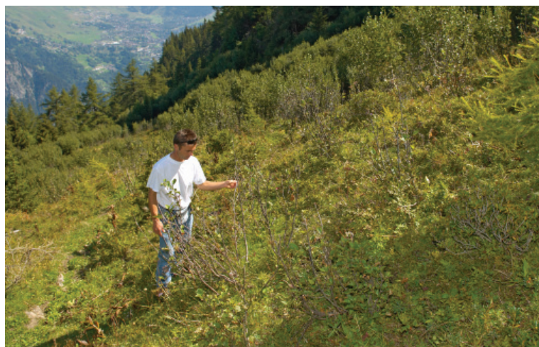
Pascolo colonizzato da ontano verde.