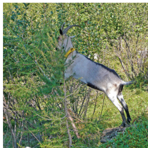
Le capre consumano volentieri la maggior parte delle essenze legnose. Eccone una, eretta sulle zampe posteriori, impegnata con un larice.

La produzione di latte di capra e la gestione delle aree marginali si possono combinare molto bene allevando una delle razze seguenti: nera Verzasca, camosciata delle Alpi, striata dei Grigioni e capra pavone. Risultati soddisfacenti si ottengono anche con la Saanen e la capra del Toggenburgo. Per la sola produzione di carne, più agevole e meno impegnativa, ben si prestano: la capra grigia, la Boer (non troppo selvatica), la sangallese dagli stivali e la vallesana dal collo nero.