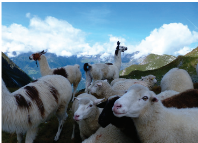
Pascolo misto con pecore e lama in alta montagna. Fotografia: E. Nucera, AGRIDEA.

Bovini ed ovini non riescono quasi mai a ridurre la quota di essenze legnose presenti in un pascolo. Per centrare questo obiettivo, ci si affida alle capre o si interviene direttamente. La lotta meccanica abbinata al pascolo dà buoni risultati contro alberi ed arbusti a crescita rapida, come: rosa canina, rovi ed ontano verde. Lo sviluppo di specie legnose a crescita lenta che non ricacciano (ginepro) si può frenare solo con la lotta meccanica (sfalci o trinciatura). Gli erbicidi sono un ulteriore mezzo di lotta diretta contro il rimboscimento. Si consiglia l'uso di prodotti selettivi nei confronti delle graminacee e si rende attenti al rispetto delle prescrizioni contenute: nell'ordinanza sui pagamenti diretti (OPD), nella legge forestale (LFO) (se la superficie da diserbare è considerata come bosco) o in un eventuale contratto regolato dalla legge sulla protezione della natura e del paesaggio (LPN).