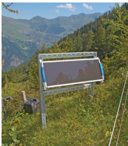
Pastore elettrico a batteria alimentato da un pannello fotovoltaico. In condizioni d'esercizio, la tensione è di circa 6 kV.

Per le capre bisogna prevedere un recinto formato da almeno tre fili, mentre, se pecore ed agnelli pascolano insieme, di fili ne servono quattro. In questi casi, una buona alternativa è rappresentata dalle reti elettrificate, soprattutto per la loro facilità di posa.